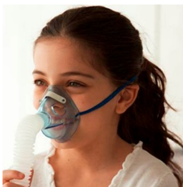
Alsó és felső légutak kezelésére: felnőtt és gyerek maszkal.