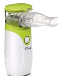
Ultrahangos extra csendes hordozható inhalátor. Elemes