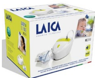
Kompresszoros inhalátor hálózatról működik.